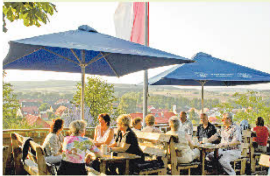
Hirschenkeller in Burgebrach.