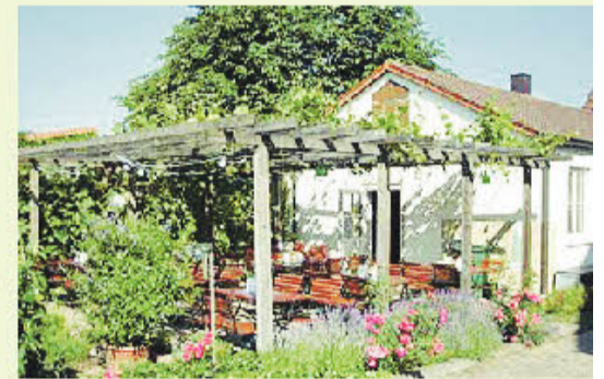
Weingut Knoblach in Nordheim/Main.

Deswegen wollen wir an dieser Stelle auch noch einmal Dankeschön sagen an all die treuen Leser, die mit Ihrem Feedback zur fortwährenden Entwicklung unserer Bücher und zu über 60.000 verkauften Exemplaren beigetragen haben.