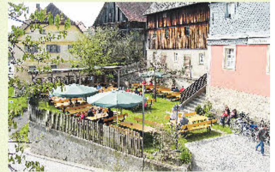
Hübner Bräu in Steinfeld.