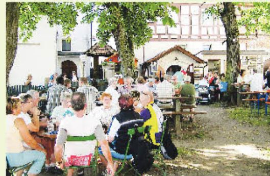
Biergarten der Schlossbräu Reckendorf.