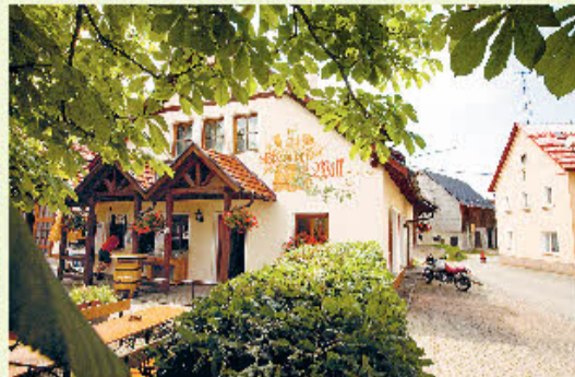
Biergarten der Brauerei Will in Schederndorf bei Stadelhofen.